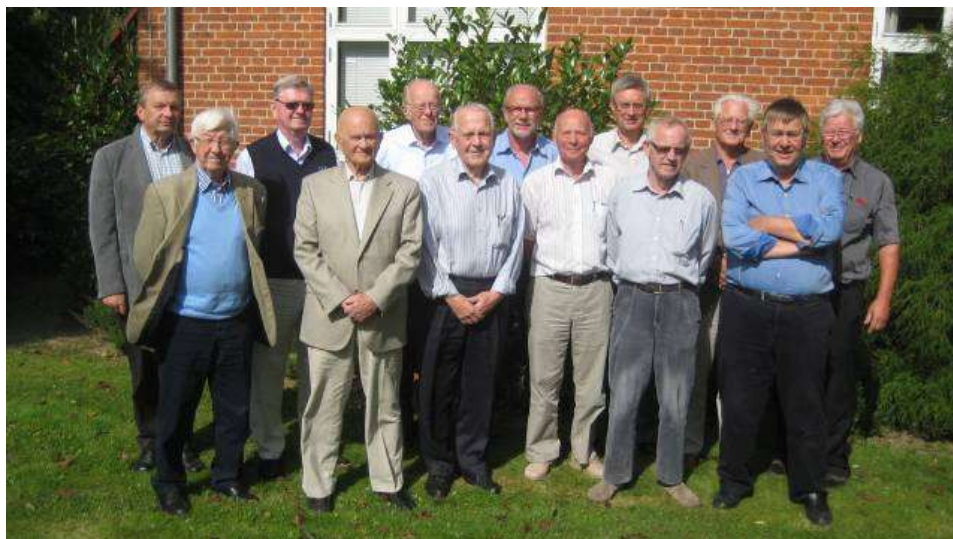
Fra den stiftende generalforsamling 8. september 2010

Formålet med forbundet er at udbrede kendskabet til tarokspillet i Danmark