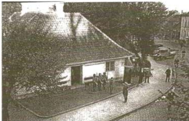
Danmarks Port blev opført i 1925 og vagten skiftede fra Prinsens Port. Vagtafløsningen overværes af en politibetjent, nogle civile og frivagter. Trafikken fortsætter uanfægtet. Officeren er i uniform model 1923.

midlerlertidigt været på Fredericia Bymuseum.