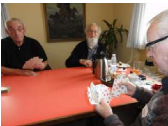
Frode Jakobsen Aage Fredslund Bent Agger